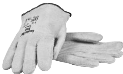
Guanto Anticalore Crusader cm. 24 ART. 240160 Tg.10 (2443) - (43XX4X)