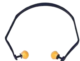
Inserti Auricolari 3M 1310 (e Ricambi 3M1311) INSERTI ART. 8.200 RICAMBI ART. 8.205