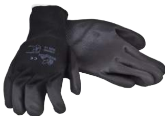
Guanto Poliuretano Nero ART. 237064 Tg. 7/11 (4131)