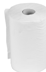
Rotolini Asciugamani Cellulosa 2 Veli ART. 3011