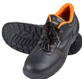
Scarpa Base B153 Bassa in Pelle S3 ART. 4702 Tg. 38/47