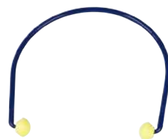
Inserti Auricolari Ear Caps (e Ricambi Ear Caps) INSERTI ART. 8.201 RICAMBI ART. 8.206