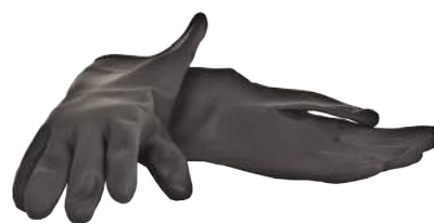
Guanto Lattice Marigold G17K ART. 248070 Tg. 6/10 (3121) - (AJKL)