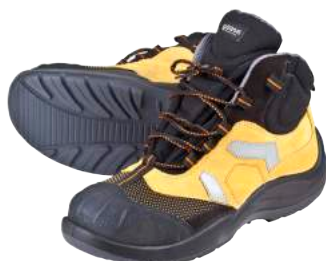
Scarpa Base B461 Extraflex S3 ART. 4705 Tg. 36/47