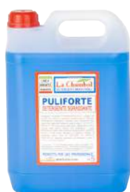
Puliforte Detergente Sgrassante Lt. 5 ART. 6069