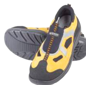
Scarpa Base B475 Four Holes S1P ART. 4715 Tg. 36/47