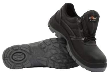
Scarpa U-Power Bassa in Pelle Simple S3 ART. 4204 Tg. 35/48