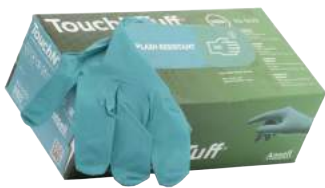
Guanto Nitrile Verde Touchntuff 92-500 100 Pz. ART. 293022 Tg. S/XL