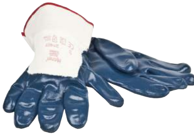
Guanto NBR con Manichetta Areata ART. 250013 Tg. 9,10 (4221)