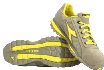
Scarpa Diadora Glove Textile S1P ART. 4136 Tg. 35/48