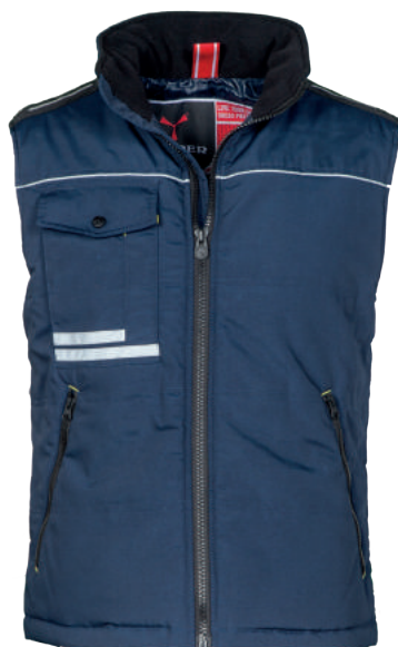
Gilet Imbottito ART. 10.260 Tg. S/5XL