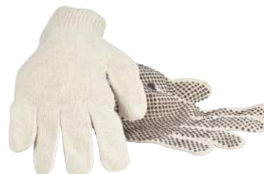
Guanto Cotone Puntinato "328" ART. 235029 Tg. 8/10 (1141)