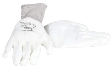
Guanto Poliuretano Bianco ART. 237060 Tg. 7/10 (4131)