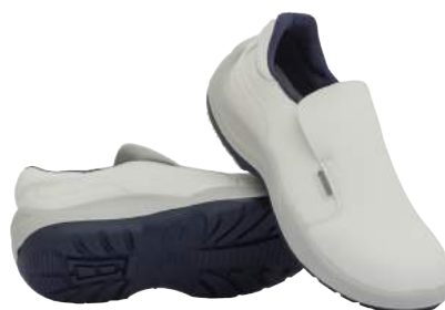
Scarpa Base B537 Bassa in Microfibra S2 ART. 4724 Tg. 35/48