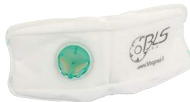
Mascherina BLS Serie 800