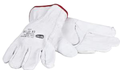
Guanto Pelle Fiore Bovino ART. 266042 Tg. 7/11 (2132)