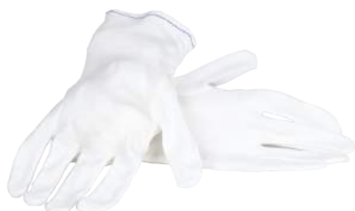
Guanto Cotone Bianco ART. 235021 Tg.7,9