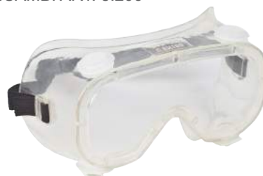
Occhiali Panoramici PVC Monolente ART. 8.102