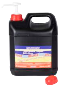
Crema Lavamani Deluxe Lt. 4 ART. 7023