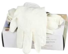
Guanto Lattice Monouso 100 Pz. ART. 290010 Tg. S/XL