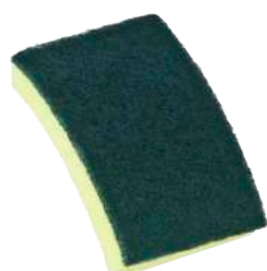
Spugne Abrasive Giallo/Verdi ART. 6002