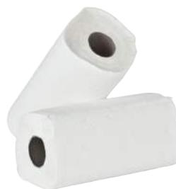
Scottex Asciugatutto 2 Veli ART. 3013