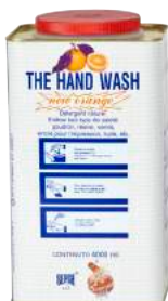
Gel Lavamani Hand Wash Lt. 4 ART. 7006