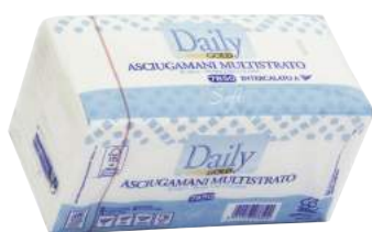
Salviette Piegata a V di Cellulosa da 3450 Pz. ART. 3017