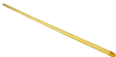
Manico in Legno cm. 130/150 ART. 5019 / ART. 5017