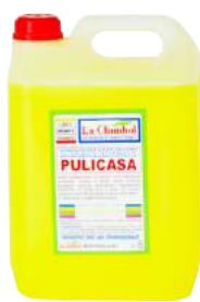
Pulicasa Detergente Lt. 5 ART. 6004