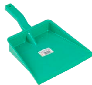
Paletta per Immondizia in Plastica ART. 5015