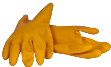
Guanto Mapa Industrial ART. 249012 Tg. 6/10 (3131) - (AKL)