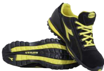
Scarpa Diadora Glove S1P ART. 4135 Tg. 38/48