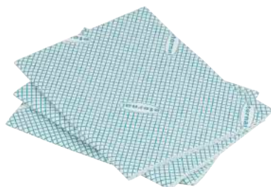
Strofinaccio per Pavimenti tipo Vileda ART. 6046