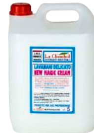
Sapone Lavamani New Magic Cream Lt. 5 ART. 7001