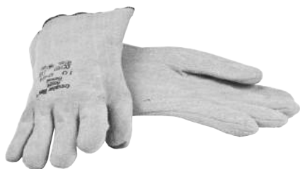
Guanto Anticalore Crusader cm. 33 ART. 240161 Tg.10 (2443) - (43XX4X)