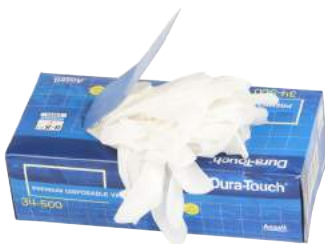
Guanto Vinile Monouso 100 Pz. ART. 240145 Tg. S/XL