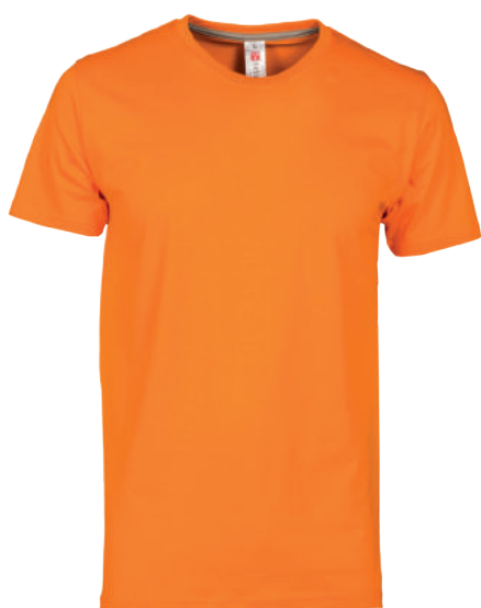
T-shirt Girocollo Manica Corta ART. 10.2001 Tg. XS/5XL