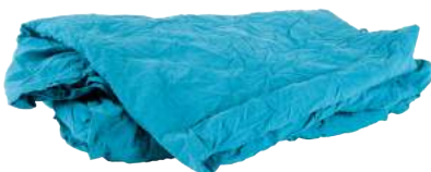
Pezzame Camici Verdi ART. 1042