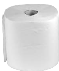
Rotoli Carta in Tnt Goffrata ART. 3002