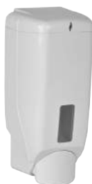
Contenitore per Liquido Lavamani ART. 5003