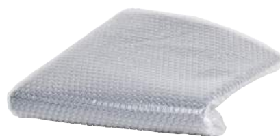
Pluriball H.50/100/125/150 H.50 ART. 9037 / H.100 ART. 9062 H.125 ART. 9061 / H.150 ART. 9066