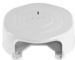
Contenitore Maxiroll Jumbo ART. 5001