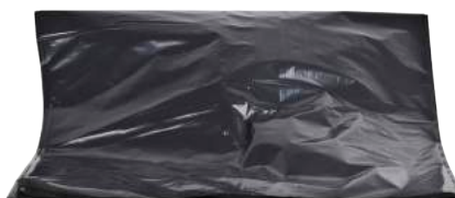
Sacchi Immondizia Grandi 90x120 ART. 5012