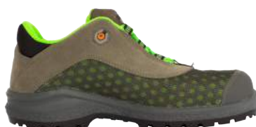
Scarpa Base B879 Be-shiny Forata S1P ART. 4780 Tg. 39/48