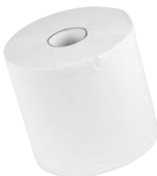
Rotoli Carta Ovatta Nazionale 2 Veli ART. 3004