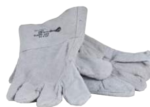
Guanto in Crosta Bovino ART. 262016 Tg. 10 (4122)