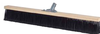
Scopone Industriale cm. 80 ART. 5007