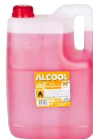
Alcool Denaturato Lt. 5 ART. 6016