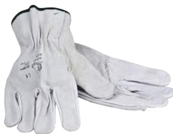
Guanto Pelle Fiore Bovino Dorso Crosta ART. 268014 Tg. 7/11 (2142)