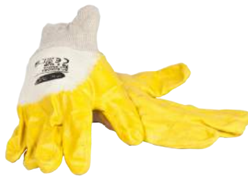
Guanto Sonora NBR ART. 253049 Tg. 7/10 (3111)