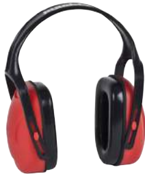
Cuffie Antirumore Newtec C2 ART. 8.211

Soluzioni per i rischi acustici, visivi e del capo presenti in un contesto lavorativo attraverso linee di prodotti come inserti e tappi auricolari, cuffie antirumore, occhiali ed elmetti.