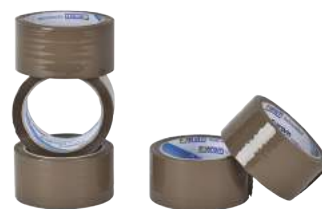
Nastro per Imballo Avana 50 mm x 66 mt ART. 9004