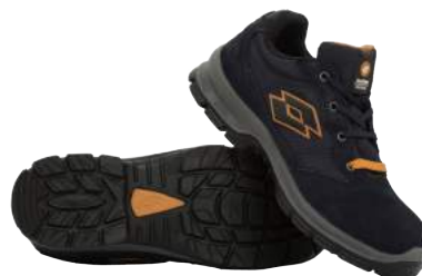
Scarpa Lotto Sprint 401 S1 ART. 4510 Tg. 36/47