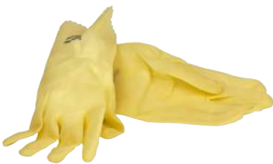
Guanto Satinato Lattice Duzmor 87-600 ART. 220000 Tg. 6/10 (X010)