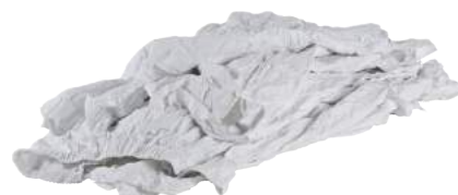
Pezzame Camici Bianchi ART. 1041