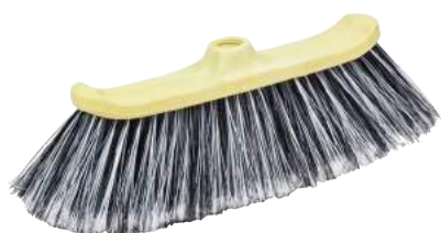
Scopa Pavone ART. 5008