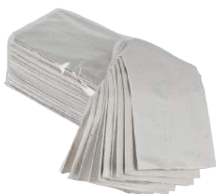
Salviette Piegata a C di Riciclata da 3600 Pz. ART. 3016