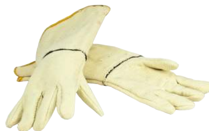
Guanto Anticalore Fibra Aramidica cm. 45 ART. 210047 Tg.10 (2442) - (43XXXX)