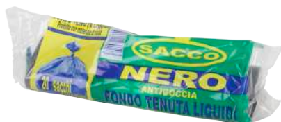
Sacchi Immondizia Piccoli 50x60 ART. 5013