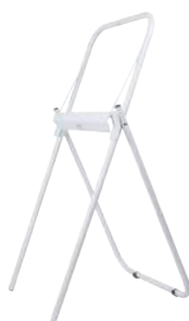
Porta Rotolo a Terra ART. 5052