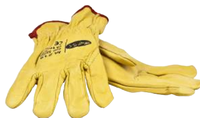
Guanto Pelle Fiore Bovino Felpato ART. 220025 Tg. 9,10 (2122)