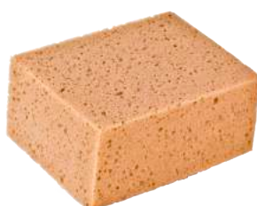
Spugne Auto Kitty F1 ART. 6001