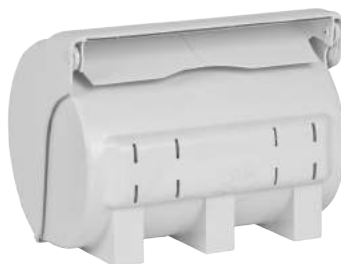
Contenitore Rotolini Asciugamani ART. 5056