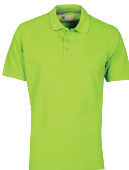
Polo Manica Corta ART. 10.2103 Tg. XS/5XL