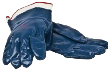
Guanto NBR con Manichetta Ricoperta ART. 250015 Tg. 9,10 (4221)