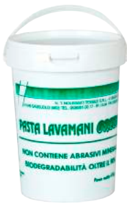
Pasta Lavamani Bianca Green Kg. 4 ART. 7004