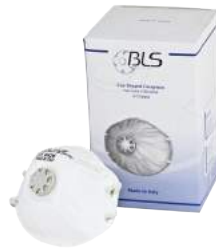
Mascherina BLS 122 FFP1V ART. 8.20