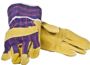
Guanto Fiore Maiale Tela 88 PAS ART. 276009 Tg.10 (1111)