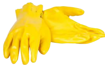
Guanto Mapa Dextram "375" ART. 249021 Tg. 6/10 (3111)