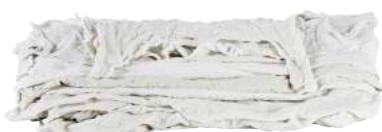
Pezzame Maglietta Bianca ART. 1008