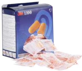
Tappi Auricolari 3M1100 ART. 3M1100