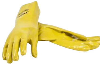
Guanto Jersey Ricoperto NBR ART. 250031 Tg. 7/10 (2121)