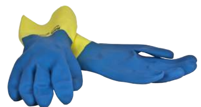
Guanto Neoprene Bicolore Mapa ART. 245040 Tg. 6/10 (2121)