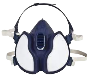
Semimaschera 3M 4251 ART. 3M4251