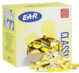
Tappi Auricolari Ear Classic ART. 8.203