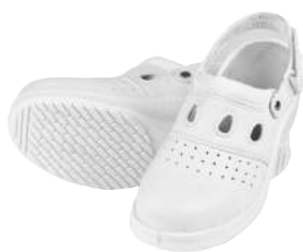
Sandalo U-Power in Microfibra Bianco ART. 4209 Tg. 35/42