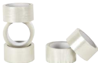
Nastro per Imballo Trasparente 50 mm x 66 mt ART. 9003