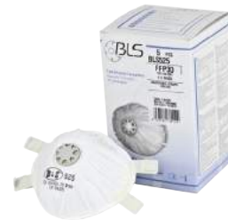
Mascherina BLS 525 FFP3V ART. 8.50