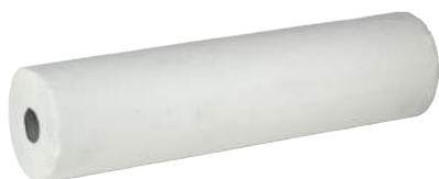
Lenzuolino Medico in Cellulosa 2 Veli ART. 30122