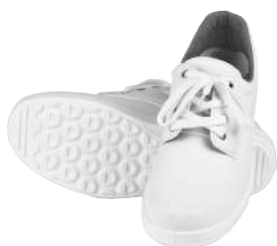
Scarpa U-Power Bassa in Pelle Bianca S2 ART. 4208 Tg. 35/47