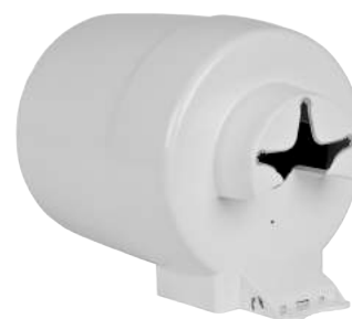
Contenitore Rotolo a Spirale ART. 5051