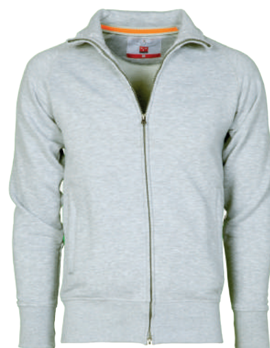
Felpa con Zip Lunga ART. 10.231 Tg. XS/5XL