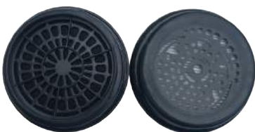
Filtri per maschere BLS