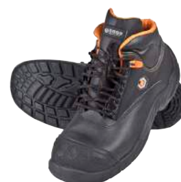
Scarpa Base B154 Alta in Pelle S3 ART. 4704 Tg. 38/47