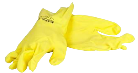
Guanto Casalingo in Lattice ART. 245014 Tg. 7/9 (1111)