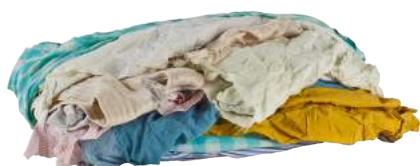
Pezzame Chiaro ART. 1015