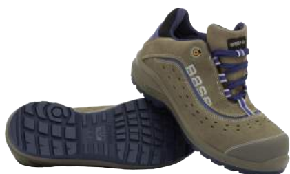
Scarpa Base B885 Scamosciata S1P ART. 4776 Tg. 36/50