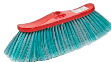
Scopa per ufficio Mirella ART.5005