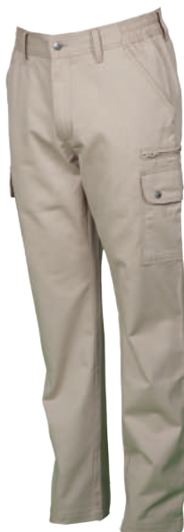
Pantalone Multitasche ART. 10.290 Tg. XS/5XL