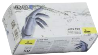
Guanto Lattice Blu Spessorato 50 Pz. ART. 290013 Tg. S/XL