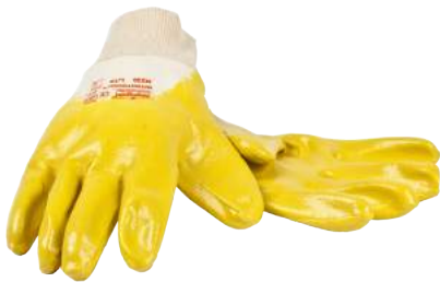
Guanto Marigold N230Y NBR ART. 250006 Tg. 7/10 (4111)