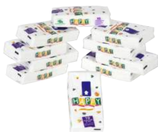
Fazzoletti di Carta da 10x10 ART. 3018