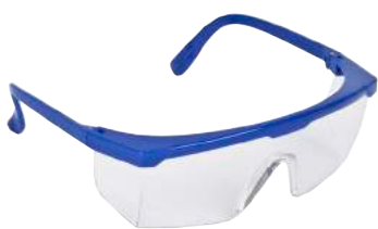
Occhiali di Protezione Lente Monopezzo ART. 8.101