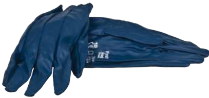
Guanto NBR Orlato Antiolio ART. 253020 Tg. 7/10 (3111)