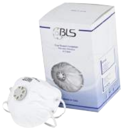
Mascherina BLS 129 FFP2V ART. 8.40