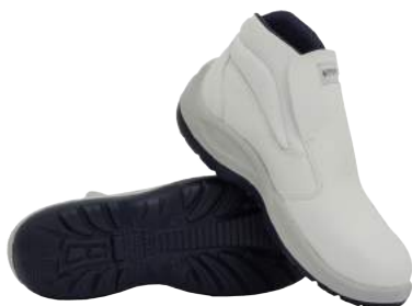
Scarpa Base B540 Alta in Microfibra S2 ART. 4749 Tg. 35/48