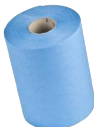
Rotolo TNT Azzurro ART. 1013