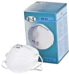
Mascherina BLS 120 FFP1 ART. 8.10