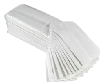
Salviette Piegata a C di Cellulosa da 3600 Pz. ART. 3015