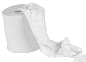
Rotoli Asciugamani a Spirale in Cellulosa 2 Veli ART. 3003