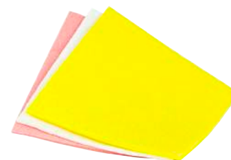
Panni Spugna Tris ART. 6049