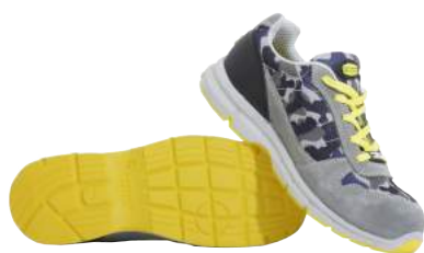
Scarpa Diadora Run Textile S1P ART. 4101 Tg. 35/48