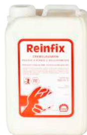
Crema Lavamani Reifix Lt. 3 ART. 7020