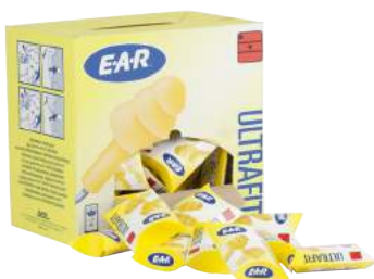
Tappi Auricolari con Cordino Ear Ultrafit ART. 8.208