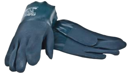
Guanto Puk Pvc Verde cm. 27 ART. 285036 Tg. 8,5-9,5 (4121) - (JKL)