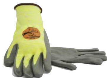
Guanto Antitaglio HYFLEX 11-423 ART. 237059M Tg. 6/11 (4332)