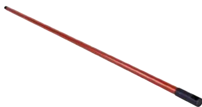
Manico in Metallo cm. 130 ART. 5018