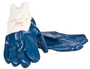
Guanto NBR con Polsino Areato ART. 250010 Tg. 8,9,10 (4221)