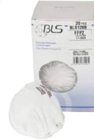
Mascherina BLS 128 FFP2 ART. 8.30