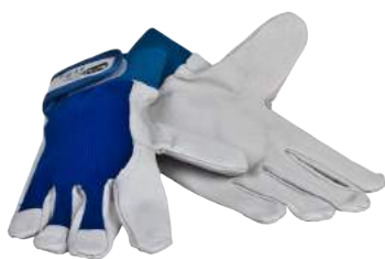
Guanto Ball ART. 276050 Tg. 7/11 (2111)