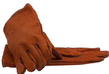
Guanto in Crosta Groppone Foderato Anticalore ART. 361047 Tg. 10 (3143) - (423x4x)