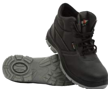
Scarpa U-Power Alta in Pelle Safe S3 ART. 4206 Tg. 35/48