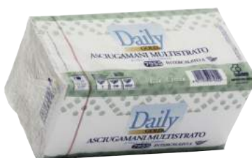
Salviette Piegata a V di Riciclata da 3150 Pz. ART. 3016Z2