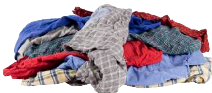
Pezzame Fiorito ART. 1014