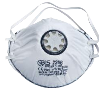
Mascherina BLS 226 FFP2V a Carboni Attivi ART. 8.43