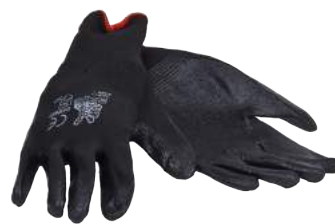
Guanto Nitrile Nero ART. 237056 Tg.7/10 (4131)