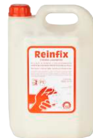
Crema Lavamani Reifix Lt. 5 ART. 7021