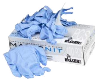
Guanto Nitrile Monouso 100 Pz. ART. 293020 Tg. S/XL