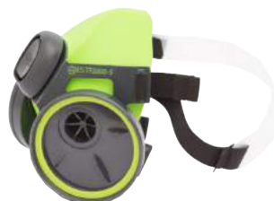
Semimaschera Siliconica BLS TP2000S ART. 8.65