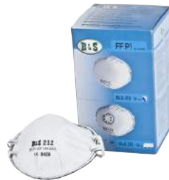
Mascherina BLS 212 FFP1 a Carboni Attivi ART. 8.12