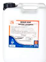
Liquido Lavamani Benur Lt. 10 ART. 7003