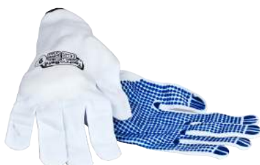
Guanto Filo Continuo Puntinato ART. 237067 Tg. 6/10 (3141)