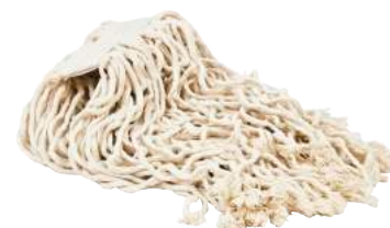
Ricambio Mop 400 gr. ART. 5060