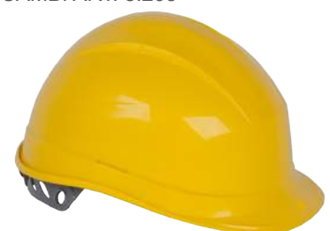
Elmetto in ABS Adamello ART. 8.223