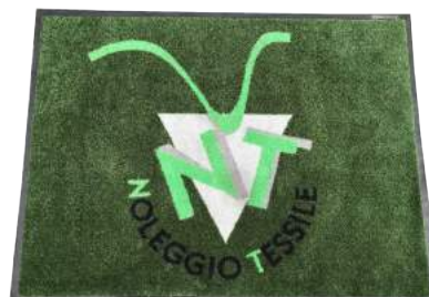
Tappeto Industriale ART. 1000P