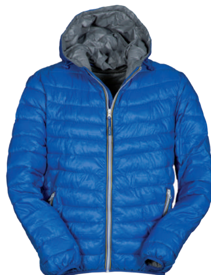
Giubbino/Piumino con Cappuccio ART. 10.2703 Tg. XS/5XL