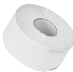
Carta Igienica Miniroll Cellulosa/Riciclata Cellulosa ART. 3008C / Riciclata ART. 3008