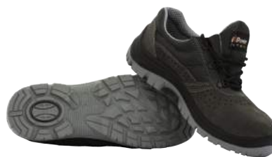
Scarpa U-Power Scamosciata Movida S1P ART. 4202 Tg. 35/48