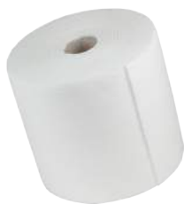
Rotoli Carta Cellulosa 2 Veli ART. 3005