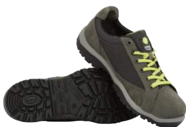
Scarpa Lotto Jump 500 S1P ART. 4511 Tg. 38/47