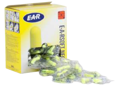
Tappi Auricolari Ear Soft ART. 8.207