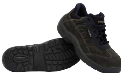
Scarpa Base B163 Scamosciata S1P ART. 4757 Tg. 36/49