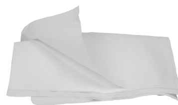
Pezzame Sintex Bianco ART. 1040