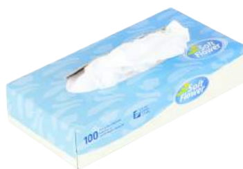
Box Veline da 100 Pz. ART. 3032