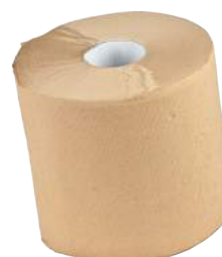
Rotoli Carta Ovatta Avana 2 Veli ART. 3006