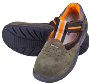
Sandalo Base B116 Scamosciato S1P ART. 4700 Tg. 36/47