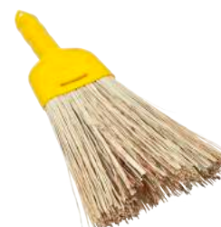
Scopino Saggina ART. 5016