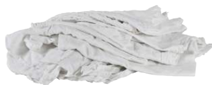
Pezzame Tovagliolo Bianco ART. 1007