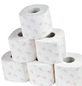
Carta Igienica Cellulosa 3 Veli da 60 Rt. ART. 3010