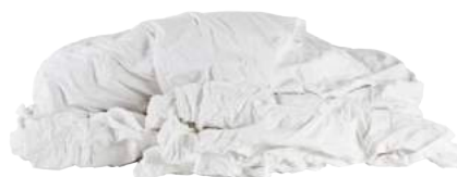
Pezzame Lenzuolo Bianco ART. 1009