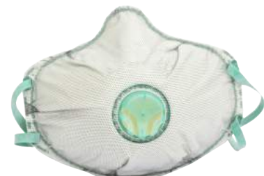
Mascherina BLS 030 FFP3V ART. 8.69