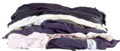
Pezzame Maglietta ART. 1005