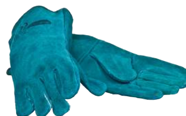
Guanto in Crosta Groppone Foderato ART. 261045 Tg. 10 (3143)