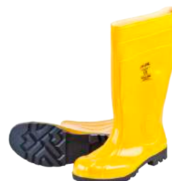
Stivali con Puntale S5 ART. 4400 Tg. 37/48