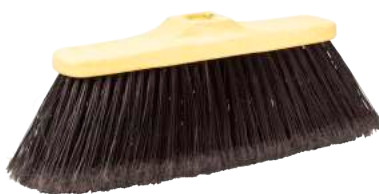
Scopa Industriale Piumata / non Piumata Piumata ART. 5006 / non Piumata ART. 5006G