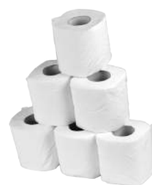
Carta Igienica Cellulosa 2 Veli da 120 Rt. ART. 3009