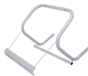
Porta Rotolo a Muro ART. 5049