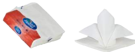
Tovaglioli di Carta 38x38 ART. 3014