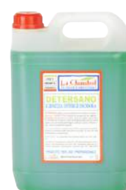
Detersano Detergente Igienizzante Lt. 5 ART. 6003