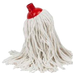
Ricambio Mocio 200 gr. ART. 5022