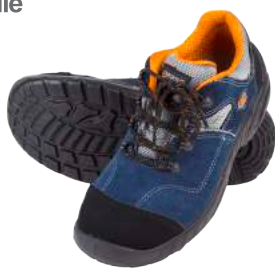
Scarpa Base B155 Tessuto S1P ART. 4730 Tg. 38/47