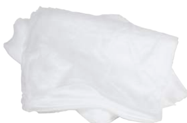
Garze Antistatiche 22x60 ART. 5014