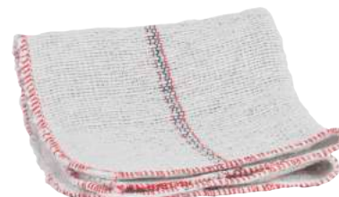
Strofinaccio per Pavimenti ART. 6044