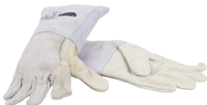
Guanto in Crosta Groppone ART. 262035 Tg. 10 (3143)