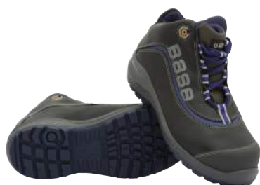
Scarpa Base B875 Alta in Pelle S3 ART. 4775 Tg. 36/50