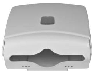
Contenitore per Salviette ART. 5002