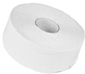
Carta Igienica Maxiroll Cellulosa/Riciclata Cellulosa ART. 3007C / Riciclata ART. 3007