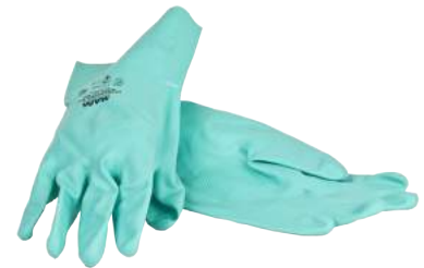
Guanto Ultranitrile Verde ART. 249010 Tg. 6/10 (4102) - (AJKL)