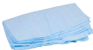
Pezzame Sampil Turchese ART. 1012P