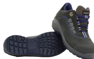
Scarpa Base B874 Bassa in Pelle S3 ART. 4774 Tg. 36/50