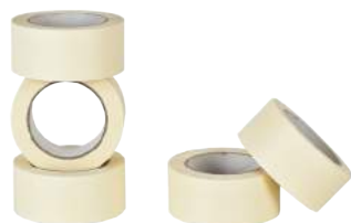
Nastro Carta Gommata 25/50 mm x 66 mt 25 mm. ART. 9018 / 50 mm. ART. 9019